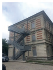
IFCS - Pavillon 16 Rez-de-chaussée – Accès par la porte vitrée derrière l'escalier de secours Parking disponible devant